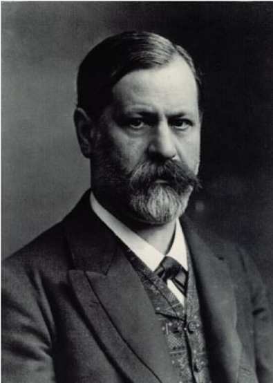
3. Фрейд (1856-1939)

словарь», «Медицинскую энциклопедию» и другие официальные, так сказать, источники.