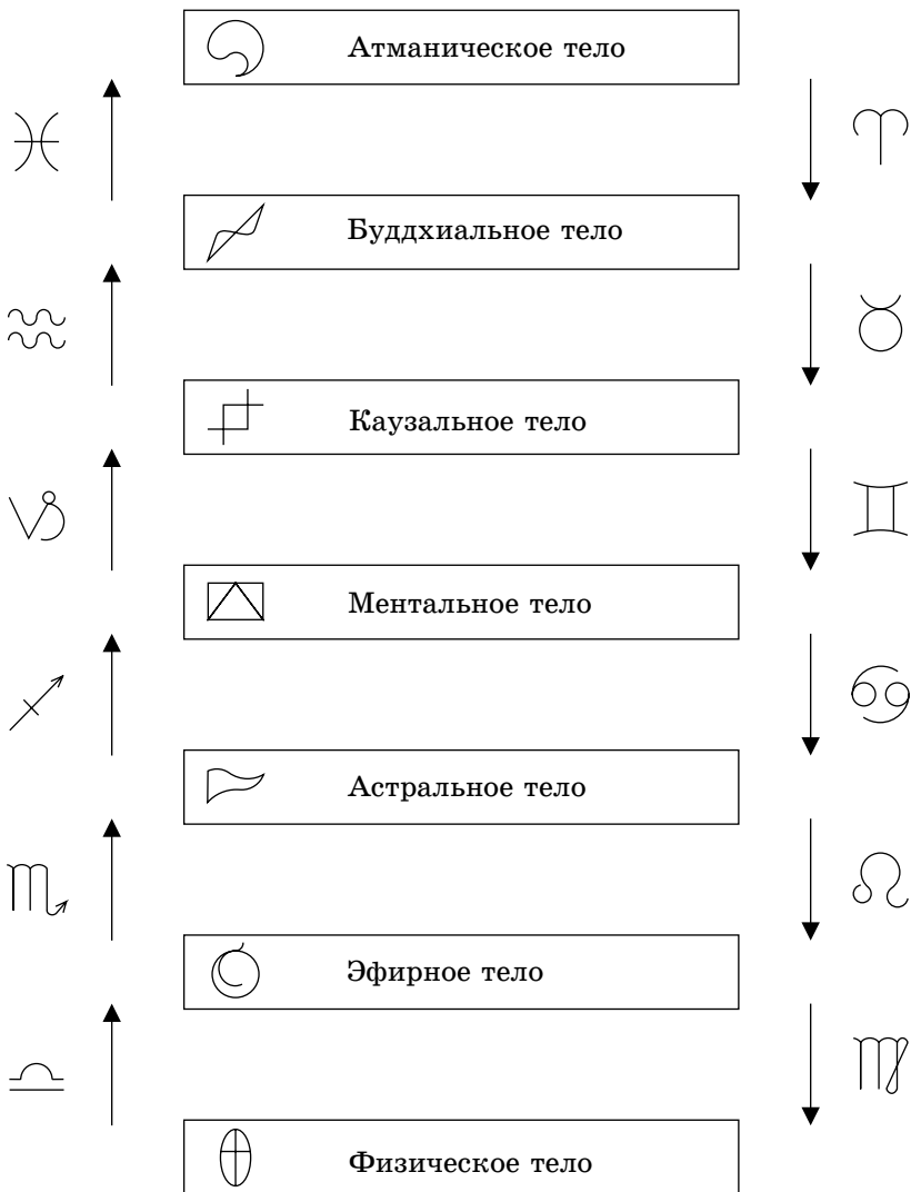
Рис. 1 Тонкие тела и зодиакальные каналы организма